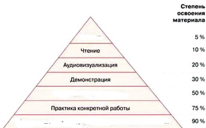
Конус опыта Э. Дейла