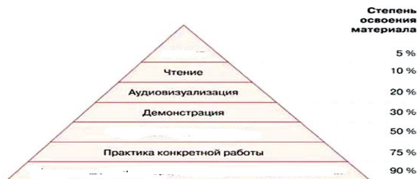
Конус опыта Э. Дейла