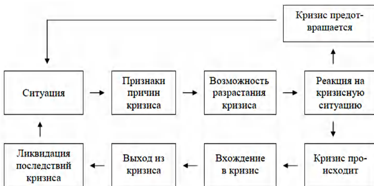
Рис. 1. Стратегия антикризисного управления

Антикризисное управление призвано предупреждать и смягчать кризисы, обеспечивать выживание фирмы в условиях кризиса и ликвидировать потери при выходе из кризиса. Ключевыми проблемами антикризисного управления явля-