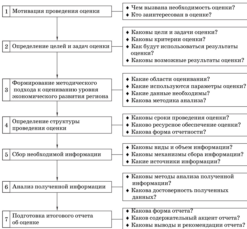
Рис. 1. Этапность оценки уровня экономического развития региона

Примечание: составлено А.Х. Курбановым с использованием результатов исследований И.Г. Видяева [2].