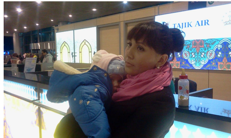
Сотрудница Фонда “Таджикистан” перед отправкой ребенка мигрантки в Таджикистан, аэропорт Домодедово, Москва, Россия