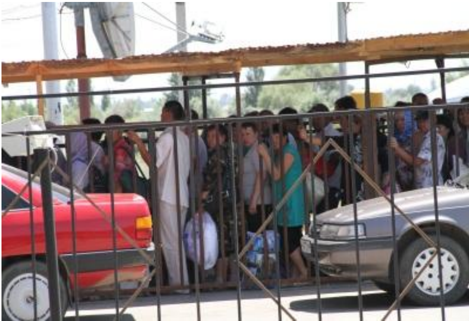
Контрольно-пропускной пункт на границе Кыргызстана и Казахстана