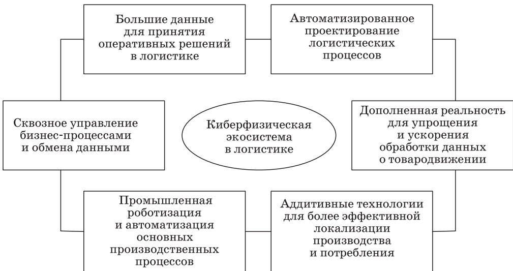
Рис. 2. Модель киберфизической экосистемы в логистике [5] Fig. 2. Model of the cyber-physical ecosystem in logistics [5]

В своей общности перечисленные инструменты формируют модель киберфизической экосистемы в логистике (рис. 2), позволяющей формировать совокупность