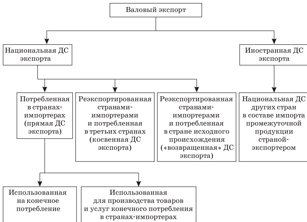
Декомпозиция валового экспорта по добавленной стоимости Decomposition of gross exports by value added