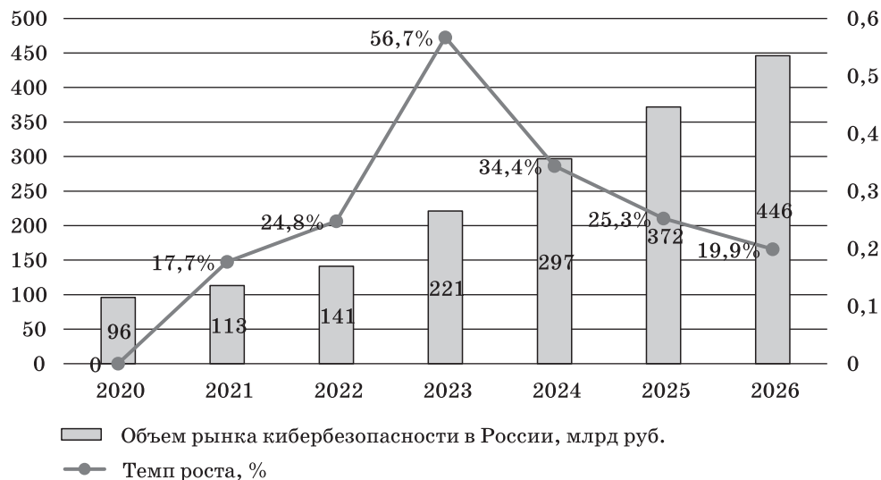
Рис. 1. Динамика и прогноз объема рынка кибербезопасности в России, млрд руб.